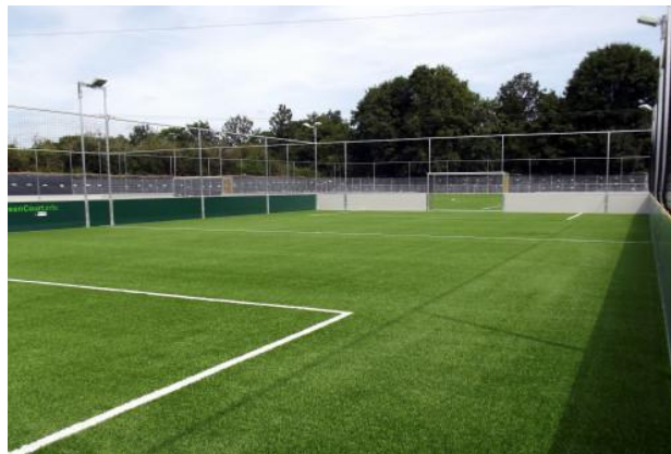
Abb. 1: Ausführungsbeispiel - Ehemaliges Tennisfeld mit modernem Kunstrasenbelag

Insgesamt werden ca. 1.000 Arbeitsstunden als Eigenleistung zu erbringen sein. Auf einer Fläche von 1.400 qm wird anschließend durch eine Fachfirma der moderne Kunstrasenbelag verlegt.